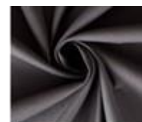
Satén algodón Negro